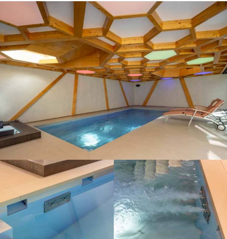
Die mächtige Decke dominiert den Raum und wird nur durch zwei Oberlichter unterbrochen, die Tageslicht in den Raum lenken. Unten: Die CAD-Zeichnung zeigt, wie die Technik ans Becken angebaut ist.